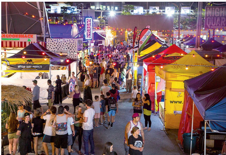
NightQuarter 市场(上图); Purling Brook 瀑布, Springbrook National Park

Gallery One Brickworks Centre Shop 16.02, 107 Ferry Road, Southport gallery-one.com.au