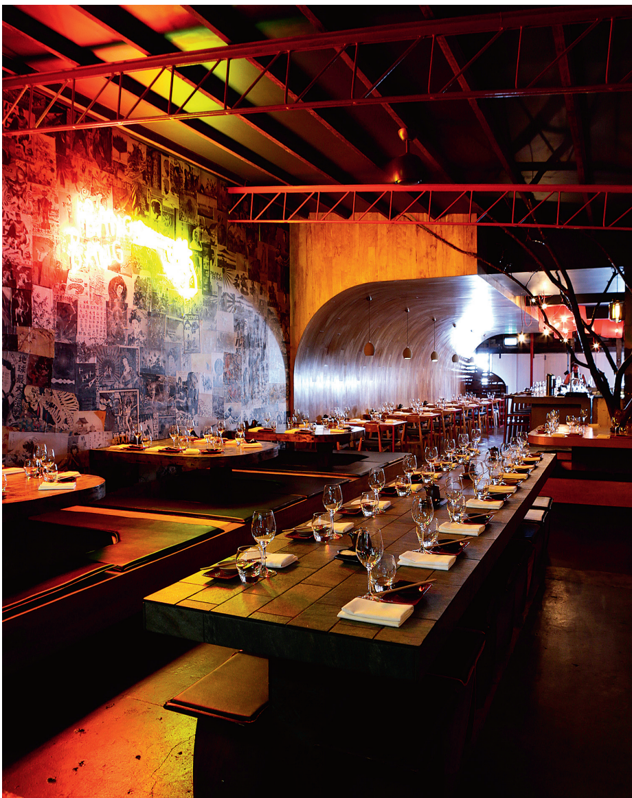
(上图起) Etsu Izakaya 日式居酒屋; The Fish House 餐厅以及游水海胆配生鲜扇贝和奥西特拉鱼子酱

📍 Shop G.12-14, Chevron Renaissance Shopping Centre; 3240 Surfers Paradise Boulevard, Surfers Paradise; (07) 5538 6565 🌐 bettyburgers.com.au 🕒 午餐和晚餐: 每日营业